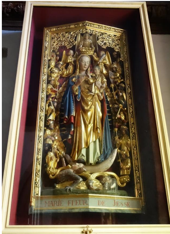
Retable de Marie, fleur de Jessé, bois, XVI e siècle

Un joyau de Trédrez, outre son enclos et le dais superbement fleuri porté par de fines torsades qui coiffe ses fonts baptismaux : le retable de Notre-Dame « Fleur de Jessé » sculpté dans un bois de chêne au début du XVI e , illustration originale de la prophétie d’Isaïe : « Une tige montera de la souche de Jessé... ». La Vierge entourée des douze rois d’Israël foule à ses pieds la lune et une démonsse écaillée qui lui tend une pomme, allusion à l’Ève de la Genèse.