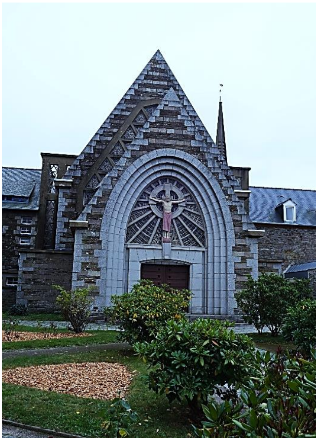
Chapelle Saint-Joseph, porche d'entrée et tympan

Entre 1935 et 1938, James Bouillé, architecte, réalise la chapelle Saint Joseph sur l'emplacement d'un ancien couvent des capucins utilisé comme établissement d'enseignement catholique : c'est un manifeste d'inventivité bretonne, avec son porche aux arcs en ellipse alliant granit, schiste vert et béton armé. Au tympan, le Christ de béton, crucifié mais couronné, inscrit dans une croix celtique rayonnante est l'œuvre du sculpteur Jules Le Bozec, membre des Seiz Breur.