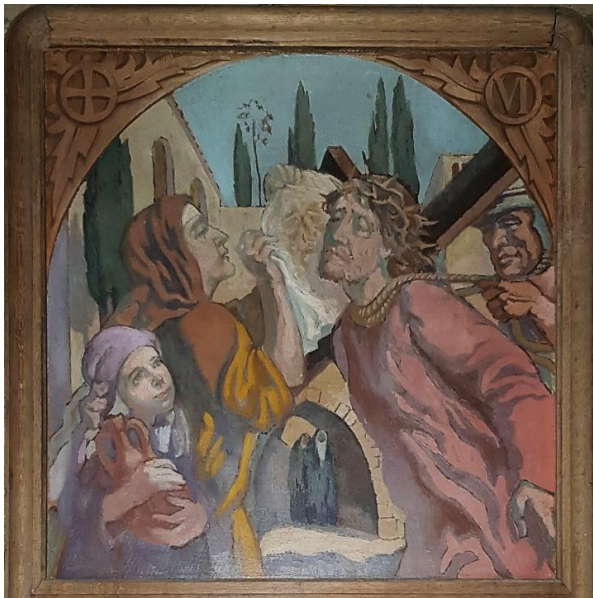
Véronique essuie le visage du Christ ; sur la gauche, la fille du peintre ; sous les arcades, les saintes femmes.

Les stations du Chemin de croix présentent un cadrage rapproché voire frontal qui accentue les expressions douloureuses ou violentes ; chaque scène peut opposer ou superposer plusieurs espaces, les lignes et la couleur sont libérées. Les tons mauves et violacés, les chairs tachées et tuméfiées, les bronze et les ocre composent une grande poésie nocturne et tragique.