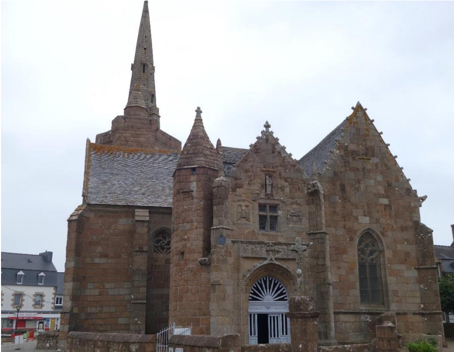
Chapelle Notre-Dame de Clarté

Notre-Dame de Clarté, une chapelle lumineuse et flamboyante, campée sur un promontoire dominant la côte sublime dans une harmonie rose et bleue, phare des marins en péril. Lions, griffons et heaumes héraldiques s'accrochent encore aux façades du XV e me; sur le linteau de l'entrée sont sculptés deux épisodes de la vie de la Vierge, une Annonciation très animée et une Pieta : le destin de Marie en ellipse.