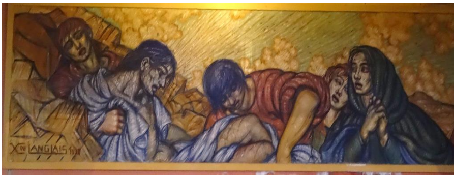
Xavier de Langlais , Xème station

Xavier de Langlais est aussi l'auteur du Chemin de croix peint en 1938 sur toile marouflée qui se déroule comme une frise sur les côtés de la chapelle : des scènes en plan rapproché, brutales ou pathétiques, des corps meurtris, tordus et disloqués par la souffrance dans un paysage pulvérisé et chaotique.