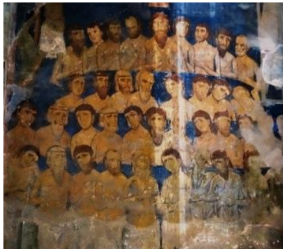
Les 40 Martyrs de Sébaste