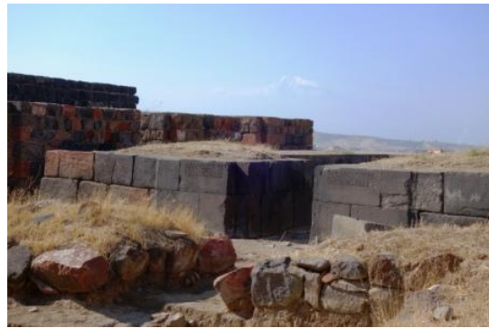
EREVAN, forteresse d'Erébouni, l'une des citadelles de l'Antiquité ourartéenne : 782 av. JC Accueil musical sur le site