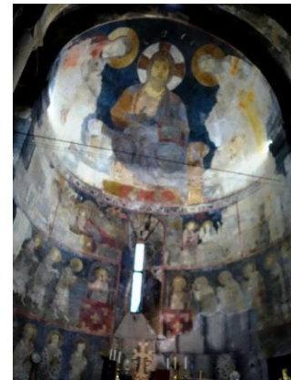
Fresque du Pantocrator, influence géorgienne