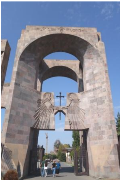
Grégoire et Tiridate Arche d'entrée, jubilé 2001 :1700è anniversaire