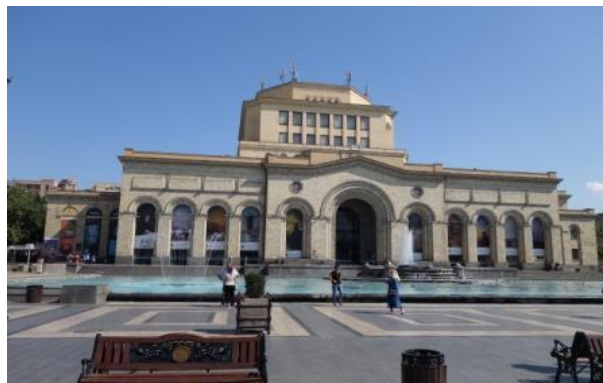
Musée d'Histoire, place de La République, les « fontaines chantantes »