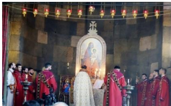
Liturgie dominicale à Ste Gayané, Etchmiadzine