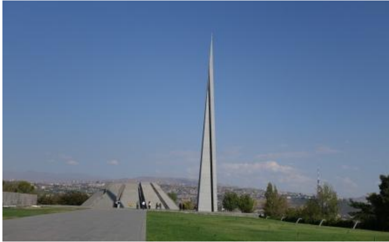
Mémorial du Génocide : émotion et compassion au cœur des 12 stèles des 12 provinces de la grande Arménie