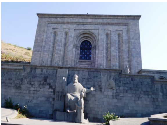
Maténadaran (Musée des manuscrits)