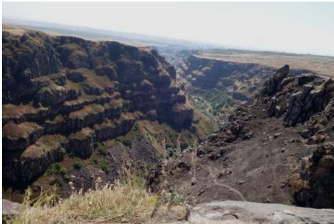
Vallée-canyon de la Kassakh