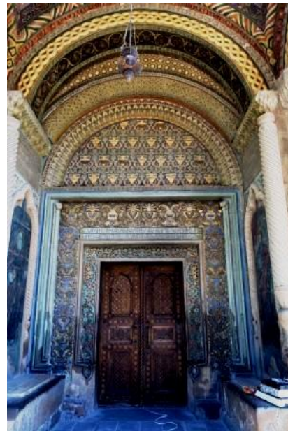
Décoration persane du porche de la cathédrale, XVIIIè