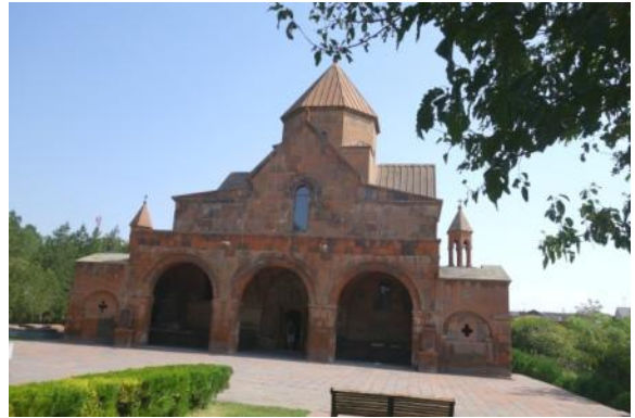
Ste Gayané, VIIè s