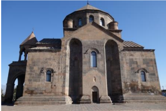
Ste Hripsimé, VIIè s.