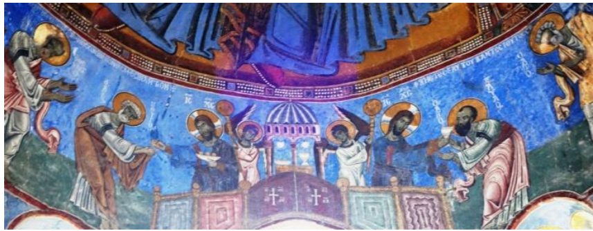
Communion des Apôtres