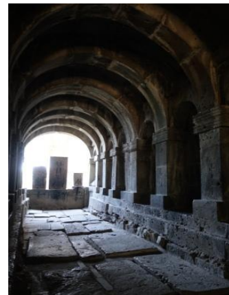
Schola de Sanahin