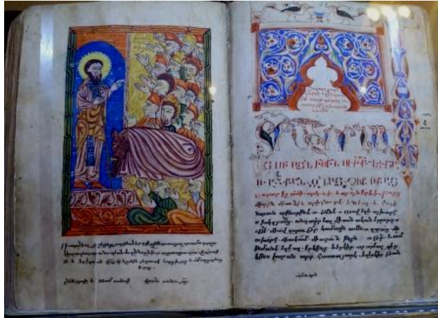
St Grégoire admoneste le roi Tiridate et lui redonne figure humaine sous les acclamations de la foule, Evangélaire du XVIè s. Matenadaran, ms n° 1920

En 301, Grégoire l'Illuminateur guérit le roi Tiridate IV, devenu sanglier pour avoir persécuté les religieuses romaines Hripsimé et Gayané et leurs compagnes ; il lui redonne sa forme humaine, Tiridate se convertit et détruit les temples païens. L'Arménie devient le premier Etat chrétien, bien avant l'Empire romain : si Constantin le Grand se convertit en 312, le christianisme, ne devient religion officielle de l'Empire qu'en 392. En 301, Grégoire reçoit la vision du plan de la cathédrale idéale à Etchmiadzine (« le doigt de Dieu »)