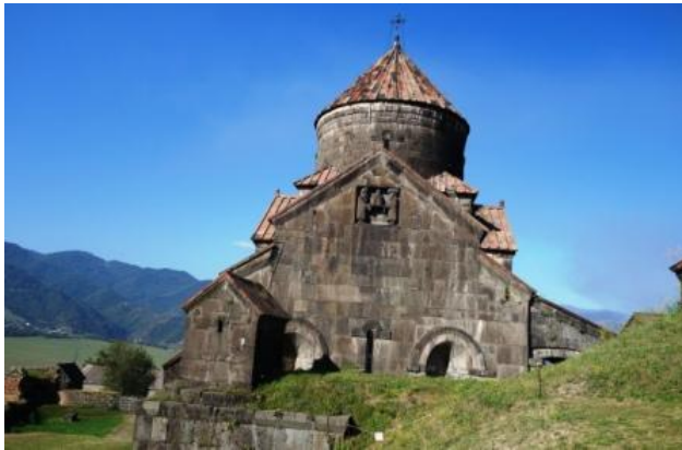
Monastère d'Haghbat, église du Saint-Signe, Xe s