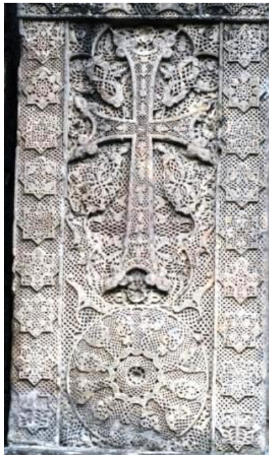
Khatchkar ( Croix de Vie), véritable broderie de pierre 1291, chapelle St-Grégoire, Goschavank

Goschavank, petite bourgade typée et ancien monastère : gavit ( narthex) , église Notre-Dame : le prêtre desservant nous y accueille et nous rappelle la raison d'être d'une église, la prière. Moment d'exception à plus d'un titre !