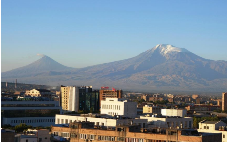
Erevan avec en toile de fond mais en Turquie, le Mont Ararat (alt.5000m) , refuge de Noë