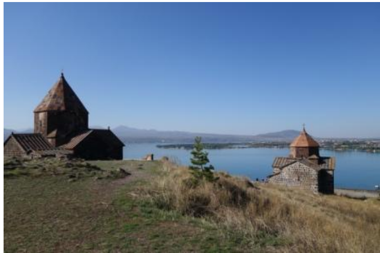
Les deux églises du lac Sevan (IX e siècle)

De monastère en monastère, à chacun sa différence