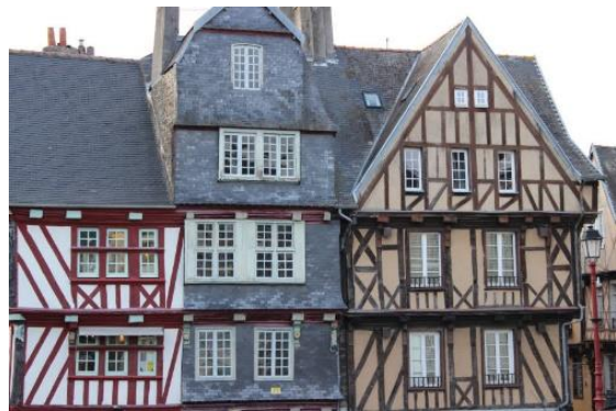
Morlaix, place Allende

Départ de l'autocar à 7 h00 , place de la République, devant la médiathèque.