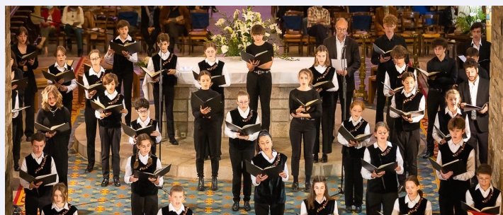
Maîtrise de Bretagne